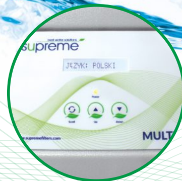
Elektroniczny podświetlany sterownik z menu w języku polskim