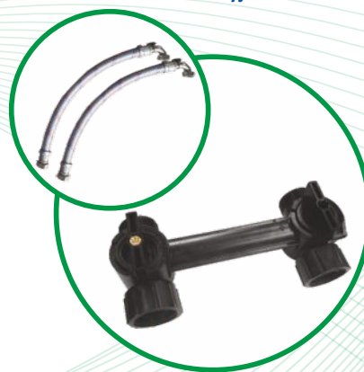
Zawór BY-PASS - opcja oraz oryginalne akcesoria marki SUPREME